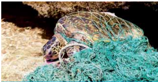
Le reti da pesca scartate possono uccidere le tartarughe marine.

Ogni anno milioni di tonnellate di spazzatura finiscono nell'oceano. E lì rimangono. I rifiuti di plastica, legno, metallo, vetro, gomma, tessuto e carta sono generati principalmente dalle attività umane e rappresentano l'unico tipo di scarti che la natura non riesce a degradare (figura F). Trasportati dal vento o dai fiumi, arrivano dalla terraferma, da discariche mal gestite, canali di deflusso delle acque piovane e strade (ad esempio, gli imballaggi dei prodotti da fast food e le lattine di bibite). Ma possono anche arrivare dal mare: basti pensare ai rifiuti gettati dalle barche e alle attività umane che hanno un impatto sull'ambiente marino, come l'estrazione mineraria in alto mare e la pesca (ad esempio, le attrezzature gettate perché non più utili).