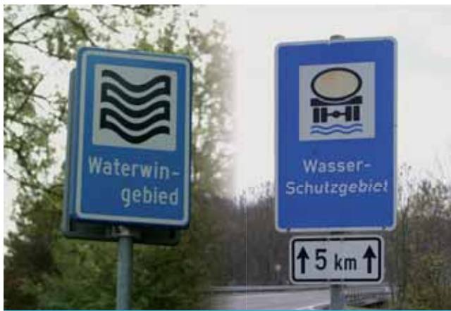
Segnali relativi alla protezione delle acque in Europa

Poiché l'acqua scorre liberamente attraverso le frontiere, gli Stati membri dell'UE hanno convenuto di gestire le risorse idriche collettivamente, a prescindere dai confini nazionali, in base ai bacini idrografici presenti sul loro territorio. Sono stati dunque identificati 110 distretti idrografici (?), compresi affluenti, estuari e acque sotterranee. Gli Stati membri che hanno un bacino idrografico in comune lavorano fianco a fianco, condividendo le responsabilità e un piano di gestione congiunto, che ognuno dovrà attuare nel proprio territorio. L'obiettivo, enunciato nella direttiva quadro in materia di acque, è assicurare il buono stato delle acque dell'UE entro il 2015 (con deroghe alla scadenza in casi particolari).