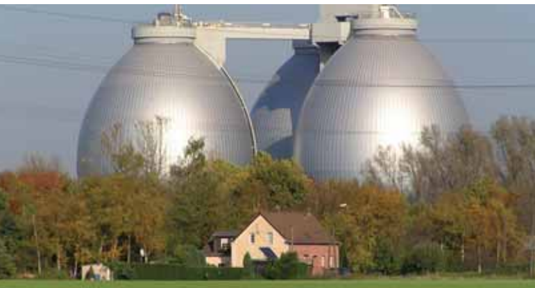
Serbatoi per la digestione anaerobica, impianto di trattamento delle acque reflue «Emschemündung» (Germania)

Pretrattamento: nella prima di due fasi preliminari, tutto ciò che arriva tramite la rete fognaria (figura D, punto 1) viene setacciato (2) per rimuovere rifiuti solidi quali rami secchi, plastica, stracci, pietre e vetri rotti, che potrebbero altrimenti otturare o danneggiare le pompe e i separatori. Gli oggetti rimossi vengono quindi smaltiti in discarica o tramite incenerimento. Nella seconda fase (3) si lasciano depositare sul fondo dei canali sabbia e ghiaia, che saranno poi lavate e riutilizzate, ad esempio per costruire strade.