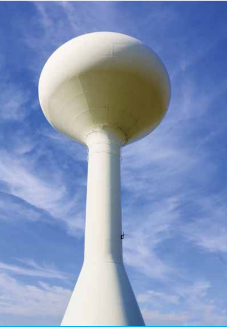
Serbatoio a torre per lo stoccaggio dell'acqua potabile