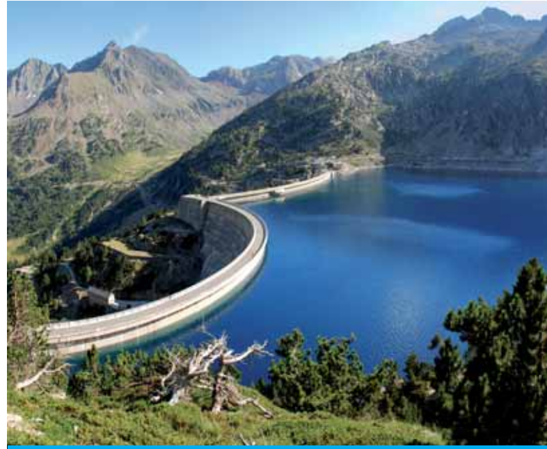
Lago artificiale di Cap-de-Long (Francia)

Oggi, questa risorsa richiede più attenzioni che mai. Se da un lato, infatti, è vero che viviamo su un pianeta la cui superficie è per la maggior parte coperta da acqua, dall'altro è vero anche che l'acqua dolce, di cui abbiamo quotidianamente bisogno, ne costituisce solo il 2,5%. Di questa, la maggior parte è inutilizzabile perché racchiusa nelle calotte polari e nei ghiacciai o perché sotto forma di neve o vapore