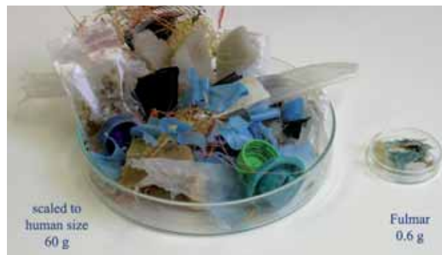
Gli uccelli marini ingeriscono rifiuti in quantità paragonabili a un hamburger per gli esseri umani...

Contribuite a ridurre l'inquinamento marino riutilizzando le buste di plastica, evitando di gettare rifiuti per strada, nei gabinetti o nei corsi d'acqua e partecipando alle giornate di pulizia delle spiagge: http://www.signuptocleanup.org . Possiamo ovviamente migliorare la gestione dei rifiuti sulla terraferma per impedire ai rifiuti di arrivare agli oceani, ma, partendo dalla base, dobbiamo tutti diventare più consapevoli delle conseguenze delle nostre azioni .