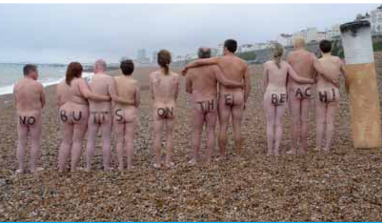
Protesta contro i mozziconi abbandonati sulle spiagge

Fare il bagno in mare, nei fiumi o nei laghi è uno dei nostri passatempi più diffusi e ogni anno milioni di europei affollano le spiagge per nuotare e rilassarsi in compagnia di parenti e amici. Ma com'è possibile conciliare le immagini da cartolina di spiagge pulite e famiglie sorridenti intente a giocare nell'acqua con tutto quello che ormai sappiamo sull'inquinamento marino? L'industria, l'agricoltura, la pesca, il turismo, le attività ricreative (per fare un esempio, l'uso delle barche da diporto) e le aree costiere densamente popolate, a causa dell'inquinamento che provocano, rappresentano una grave minaccia per l'ambiente marino e, in ultima istanza, per i nuotatori: fare il bagno in acque contaminate può infatti causare gastroenteriti, infezioni respiratorie e reazioni cutanee.