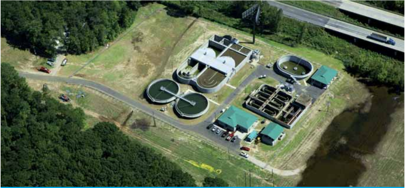
Impianto di trattamento delle acque reflue

All'inizio del trattamento è possibile l'aggiunta di sostanze chimiche (14) per provocare la precipitazione del fosforo o consentirne la raccolta sul fondo come fango.